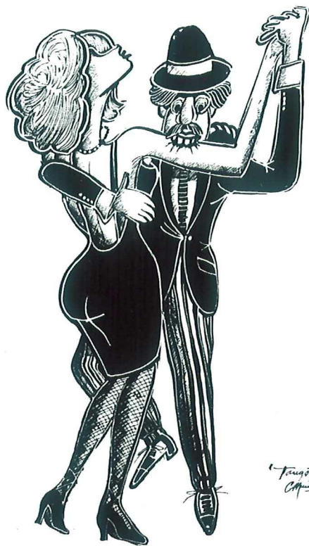
"Tango Feroz" Tinta