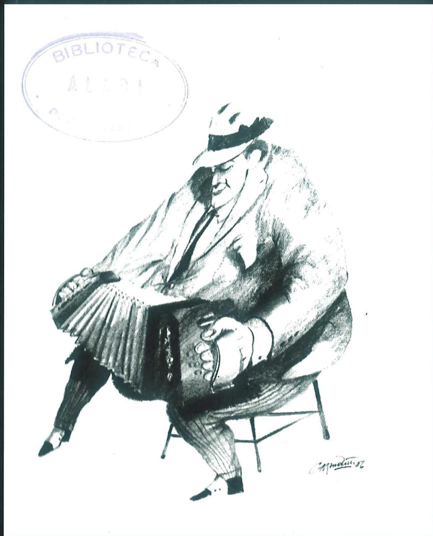
"Che Bandoneón" (Gráfico 0.50 x 0.40)