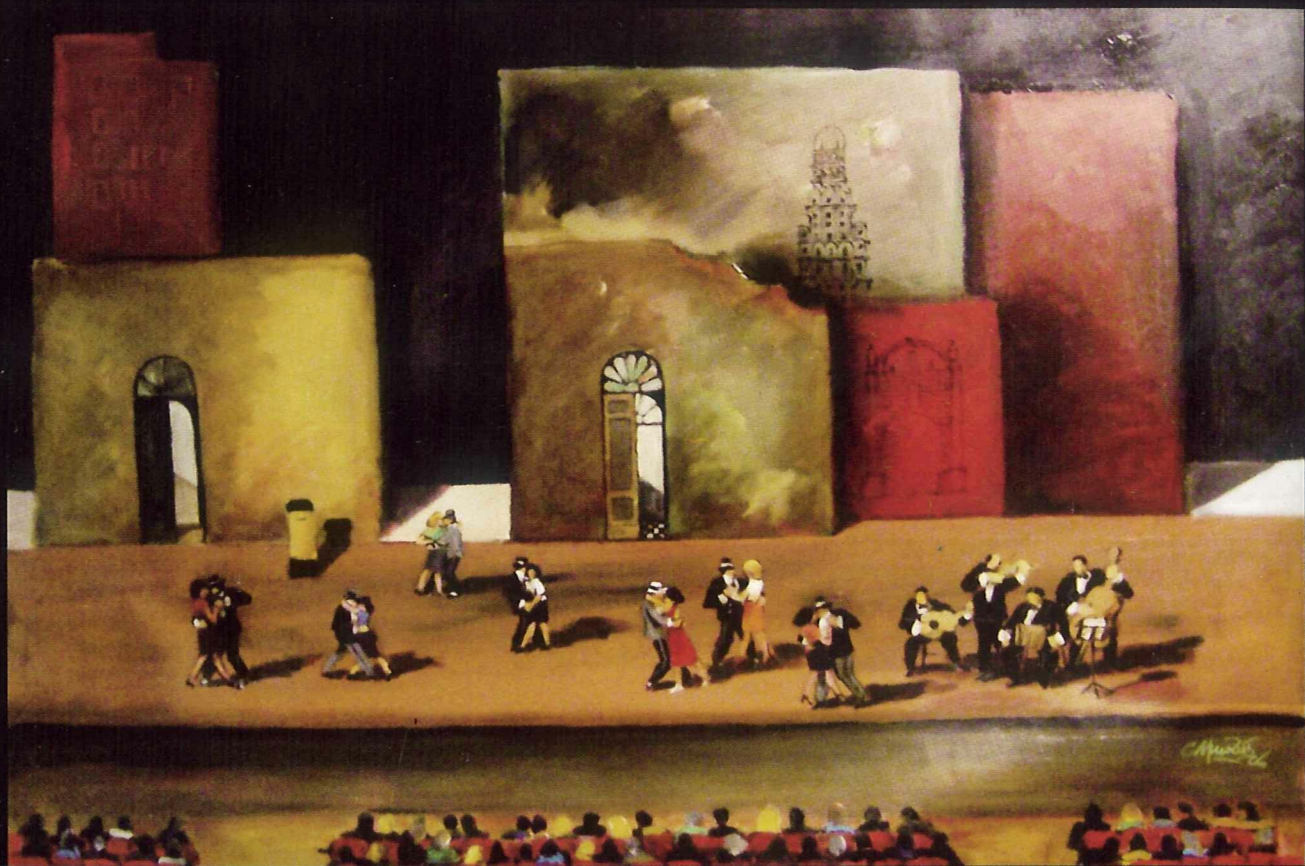
"Tango en la Ciudad Vieja" Acrílico - Técnicas mixtas sobre tela