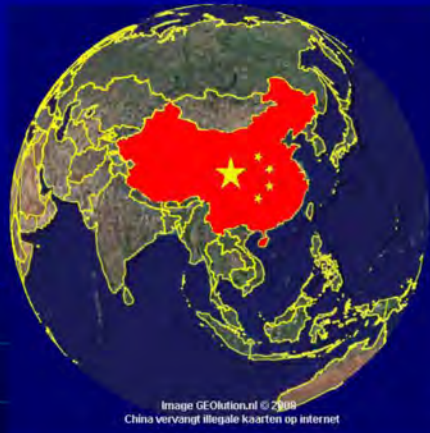
China vervangt illegale kaarten op internet